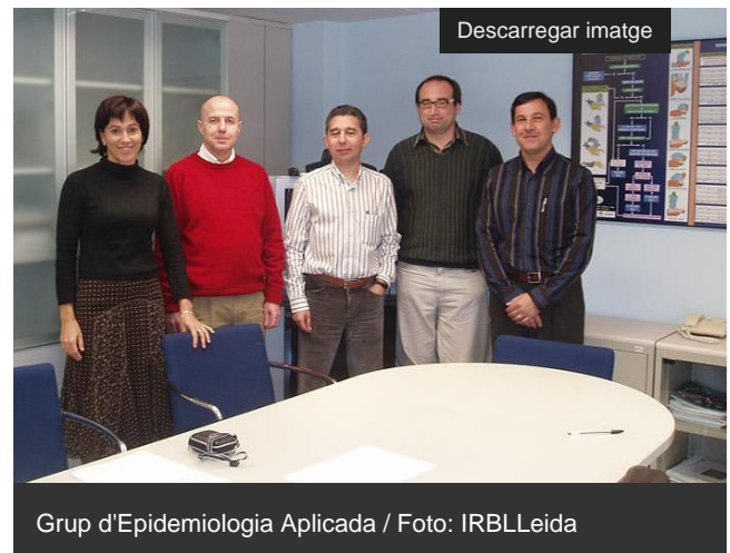
Grup d'Epidemiologia Aplicada