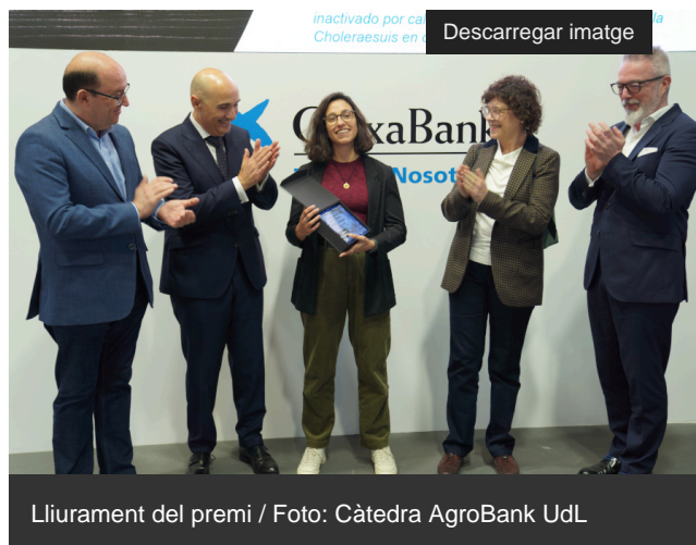
Liurament del premi

Un Treball Final de Màster (TFM) de la Universitat de Castella-la Manxa (UCLM) sobre salmonel·losi en porcs ha guanyat la quarta edició del premi La ciència en femení [