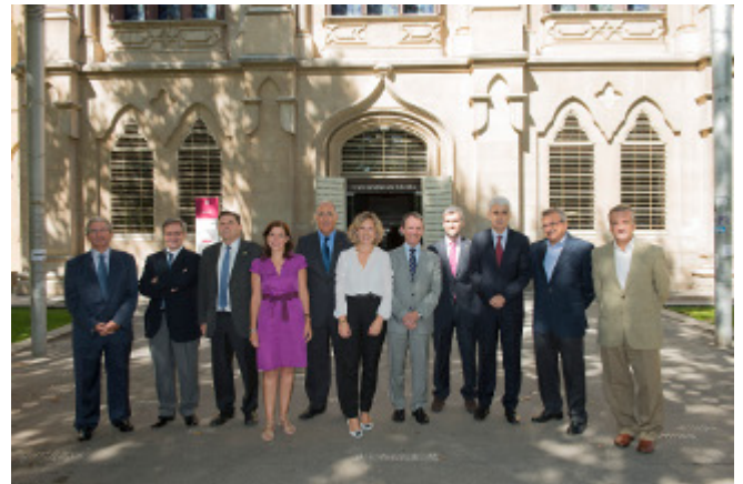
/export/sites/universitat-lleida/ca/serveis/ Els assistents a la reunió davant l'edifici del Rectorat / FOTO: UdL

El Consell rector del Campus Iberus, integrat pels rectors, presidents de Consells Socials i coordinadors del campus de les quatre universitats que el componen, a més del president del consorci, també ha donat llum verda a la Memòria d'actuacions del 2013.