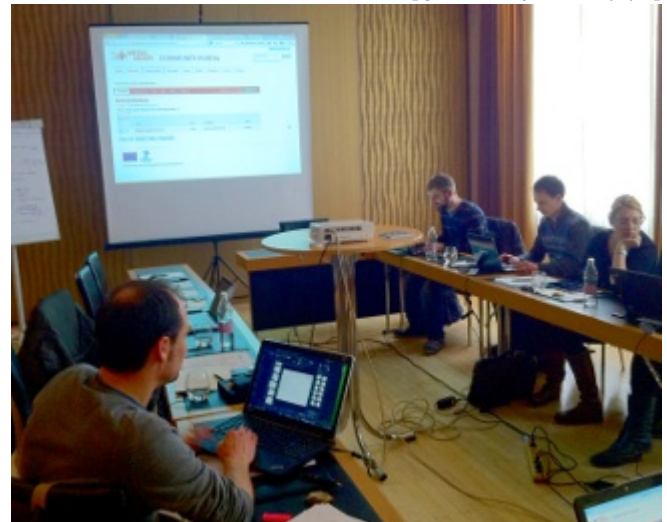
/export/sites/universitat-lleida/ca/serveis/c Reunió de treball del projecte

La Universitat de Lleida (UdL) participa en un projecte europeu per crear un mercat multimèdia de continguts audiovisuals que puguin ser reutilitzats i comercialitzats. Permetrà simplificar aspectes com l'accés, l'ús de fragments o l'obtenció de drets de propietat intel·lectual, reduint costos i rendibilitant el material existent en arxius. El Grup de Recerca en Interacció Persona Ordinador i Integració de Dades [ http://griho.udl.cat/ ] (GRIHO) de la UdL és l'únic participant estatal en una iniciativa que aplega vuit organitzacions públiques i privades de set països: Àustria, Alemanya, Regne Unit, França, Grècia, Eslovènia i Espanya.