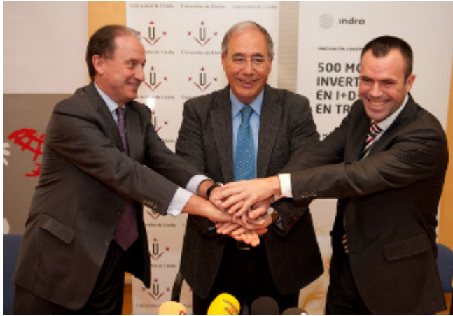
/export/sites/universitat-illeida/ca/serveis/c El rectorat de la UdL ha acollit l'acte de presentació