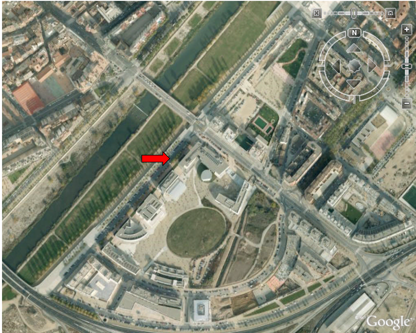
Auditori del Centre de Cultures i Cooperació Transfronterera del Campus de cappont. Lleida.