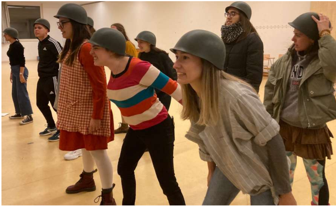
Assaig dels estudiants de la FEPTS pel musical. Foto 23.