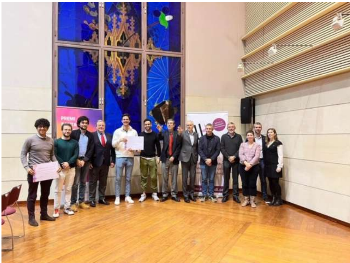
Acte lliurament de Premis Alumni-UdL empenedoria. Foto 24