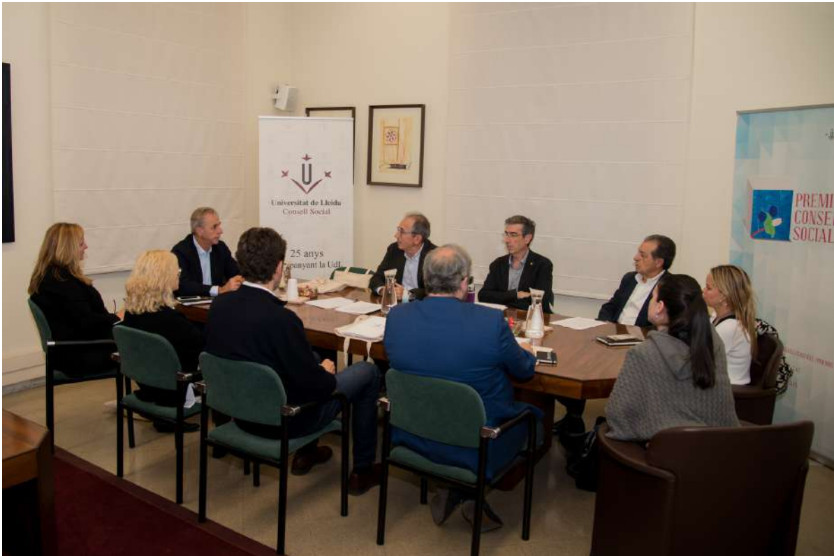
Trobada dels membres del Fòrum de participació del Consell Social. Fotos 14 i 15