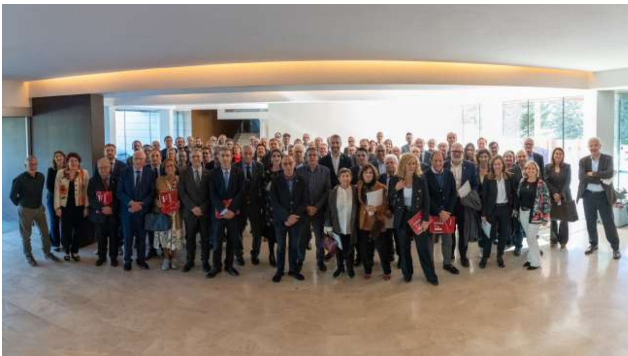
Acte celebració de 30 anys de Forum empresa. Foto 13