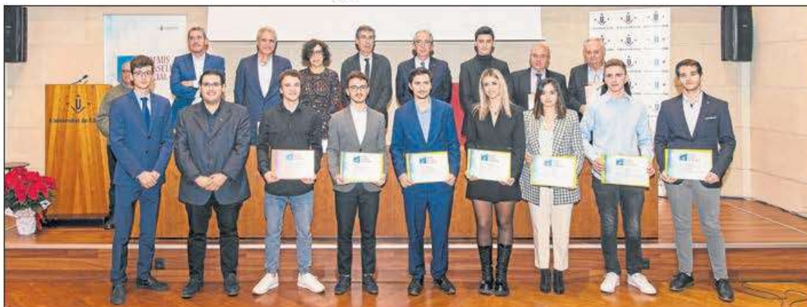
Els premis van lliurar el passat dia 25.

E ls Premis Consell Social de la Universitat de Lleida arriben a la cinquena edició consolidant-se com un referent a visibilitzar la cooperació de la universitat amb l'empresa i les institucions. D'altra banda, posen en valor l'excel·lència de la comunitat universitària a través del Treballs Finals de Grau en les diferents àrees de coneixement que ofereix la UdL i les bones pràctiques en Responsabilitat Social.