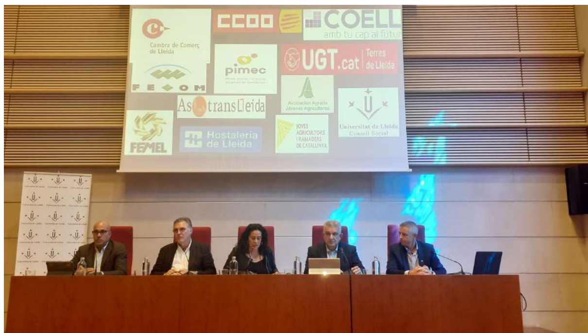
Presentació del Fòrum Secore als mitjants de comunicació. Foto 7