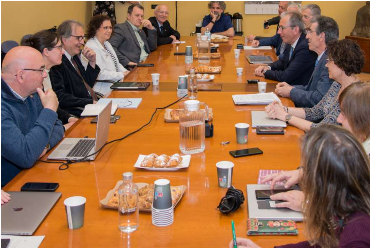
Trobada amb el ministre Joan Subirats Foto 33