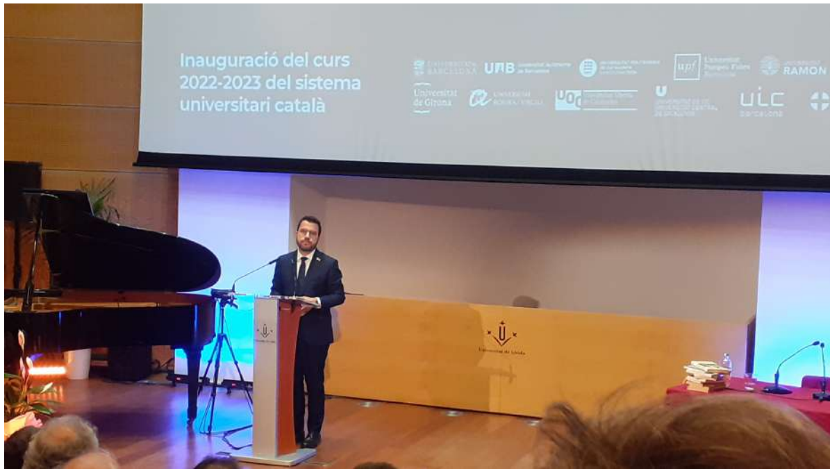
Inauguració curs acadèmic de la UdL amb el president de la Generalitat. Foto 1