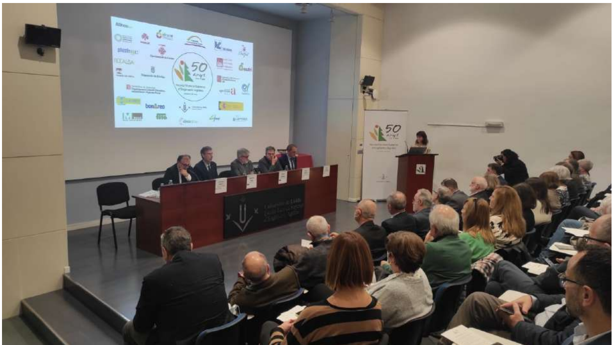
Acte celebració 50 anys ETSEA de la UdL. Foto 17