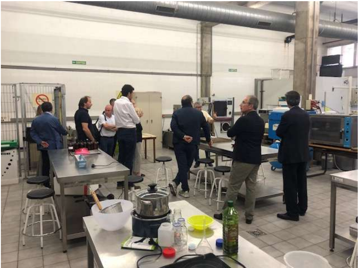
Visita al laboratori de tecnologia dels aliments d'ETSEAFIV per part de CONNECTAUdL Foto 44.