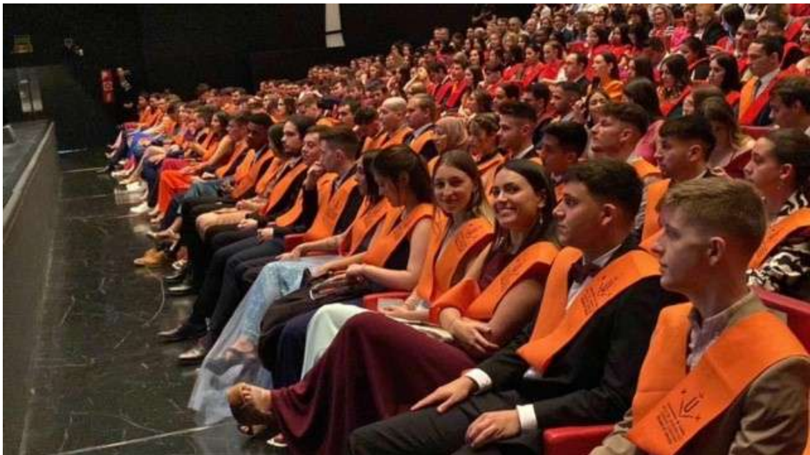
Acte lliurament Orles de la FDET de la UdL 2023. Foto 39.