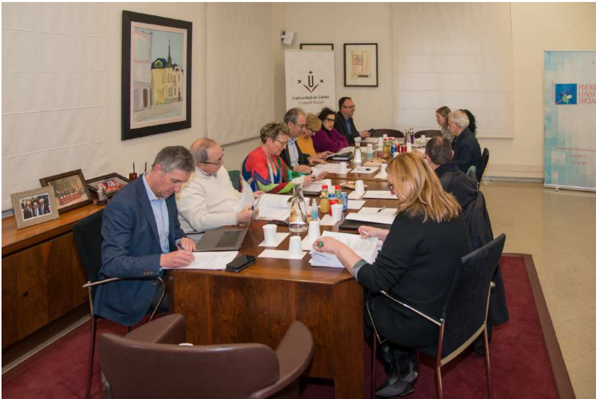
Ple 1/23 del CS de la UdL. Foto 28