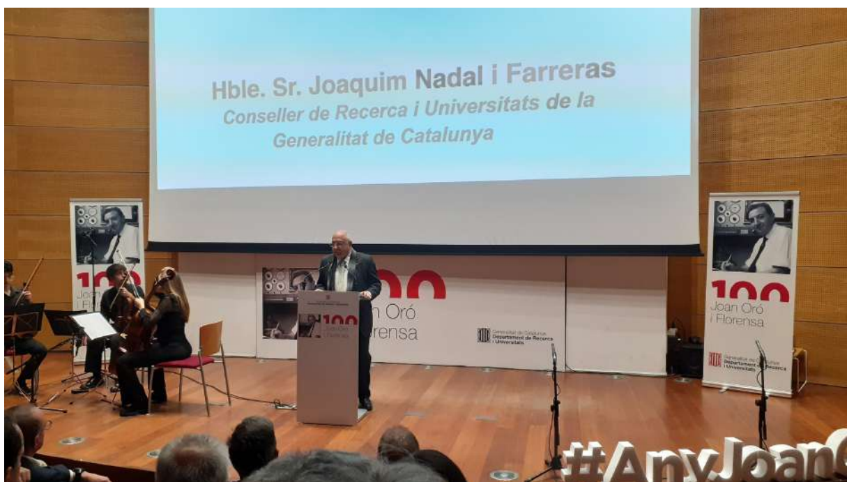
Parlament del Conseller de Recerca i Universitats en l'Acte centenari naixement Joan Oró.