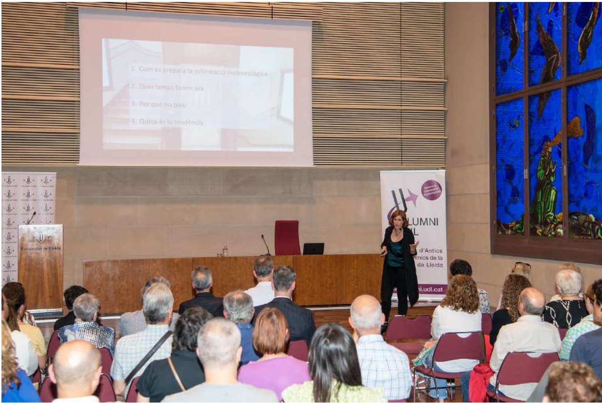
Conferència Assemblea Alumni UdL . Foto 36