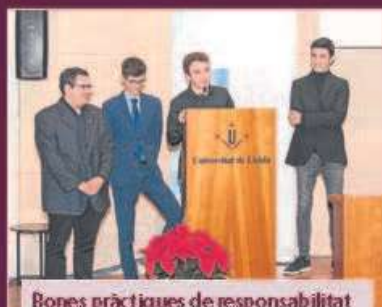
Bones pràctiques de responsabilitat social corporativa

Consell de l'Estudiantat de la UdL - Festes de l'Estudiantat: inclusives, participatives, sostenibles, segures i de proximitat!