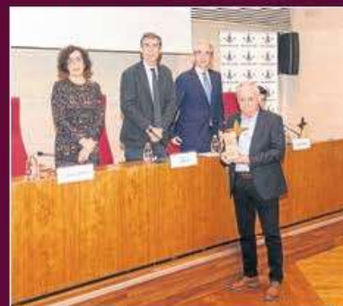
Cat. mitjana i petita empresa Industrial Lleidana del Frito, S.L.