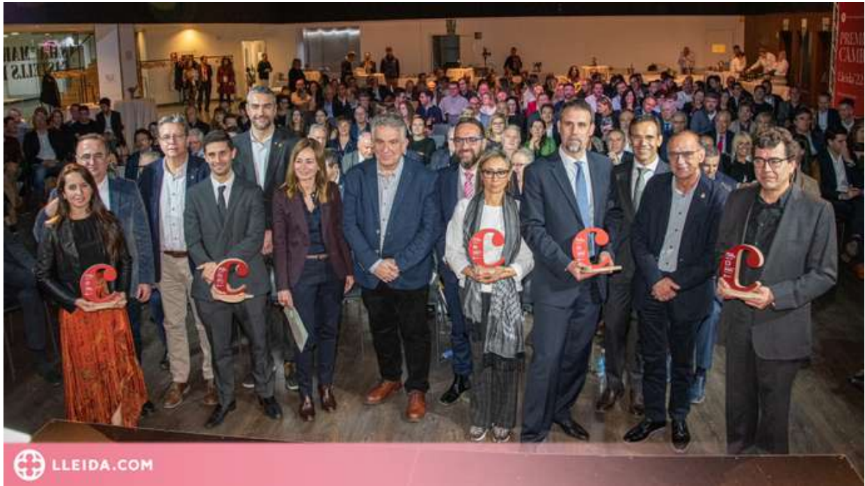
Acte de Premis Cambra. Foto 16