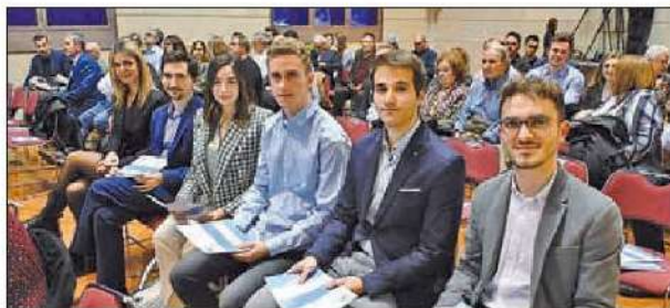
Acte de lliurament dels premis anuals del Consell Social de la Universitat de Lleida

de Catalunya; les empreses Argal Alimentación SA i Industrial Lleidana del Frio SL; les bones pràctiques de responsabilitat social corporativa del Consell de l'Estudiantat de la Universitat de Lleida. El Consell Social va reconèixer les festes que organitza l'organització de representació de l'alumnat són "Inclusives, participatives, sostenibles, segures i de proximitat".