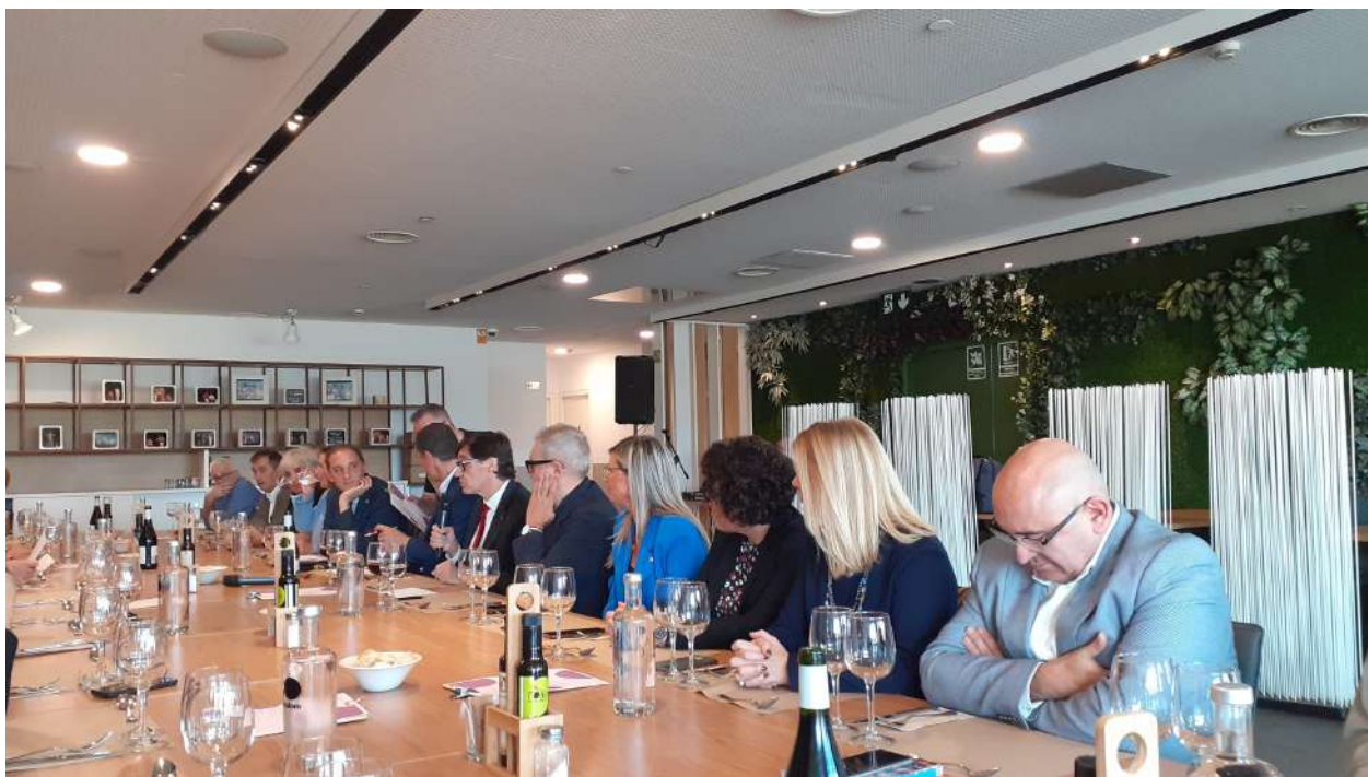
Trobada de Forum Secore amb l'equip de Salvador Illa. Foto 12