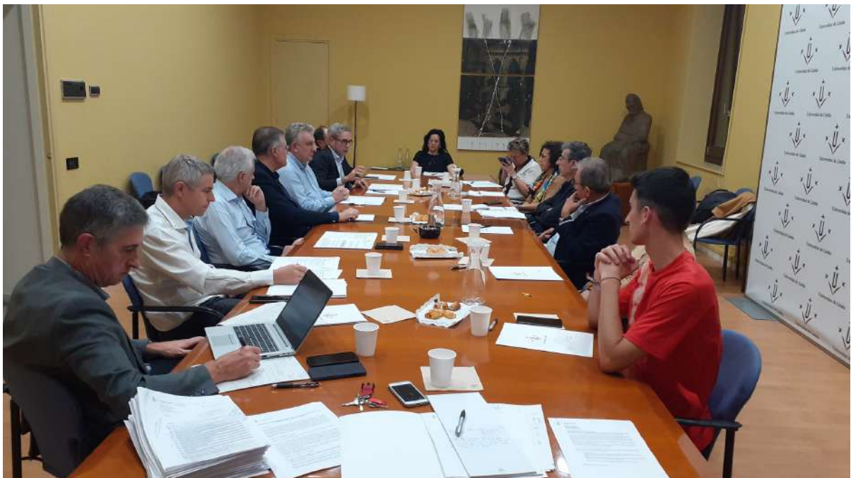
Ple 6/22. Foto 10