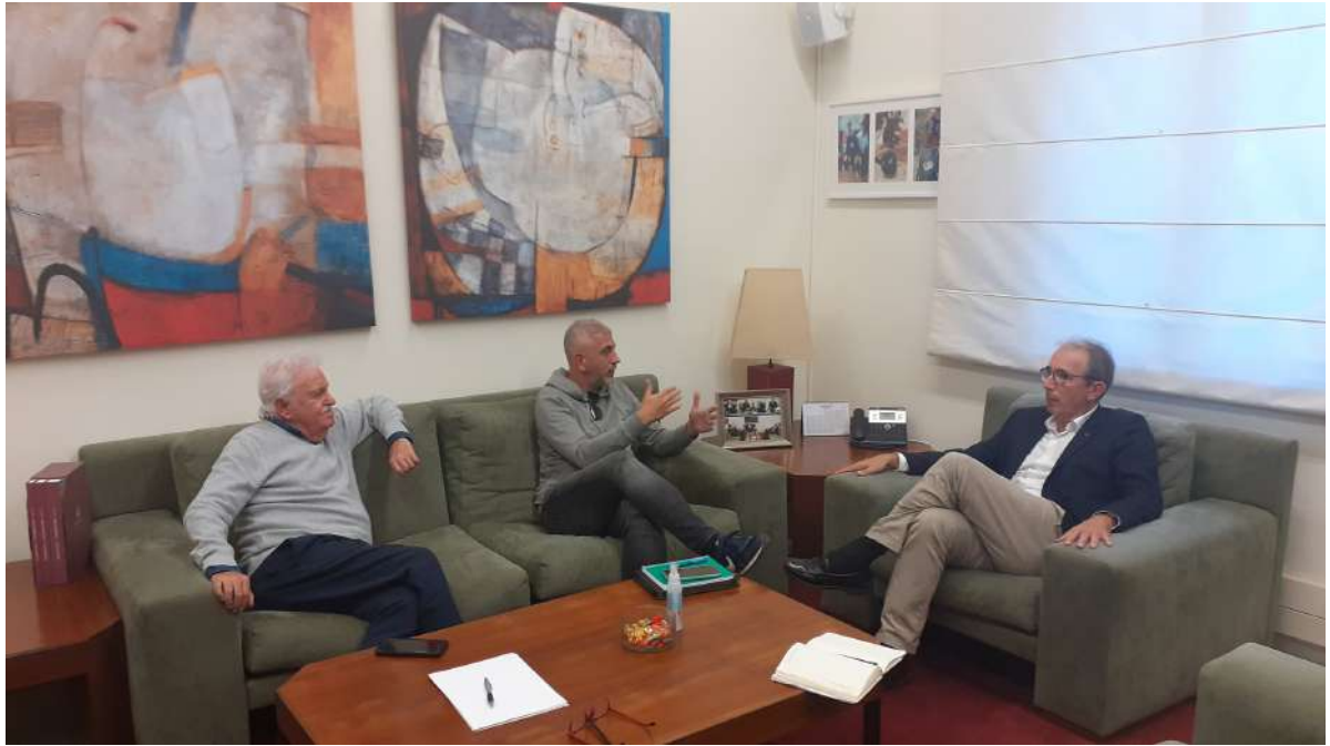
El president i el director de la Fundació Oró al Consell Social. Foto 5