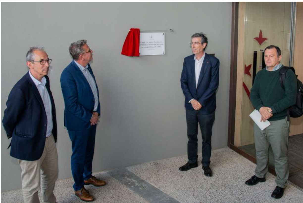
Moment de descoberta de la Placa en l'inauguració de l'Edifici Polivalent 2. Foto 34