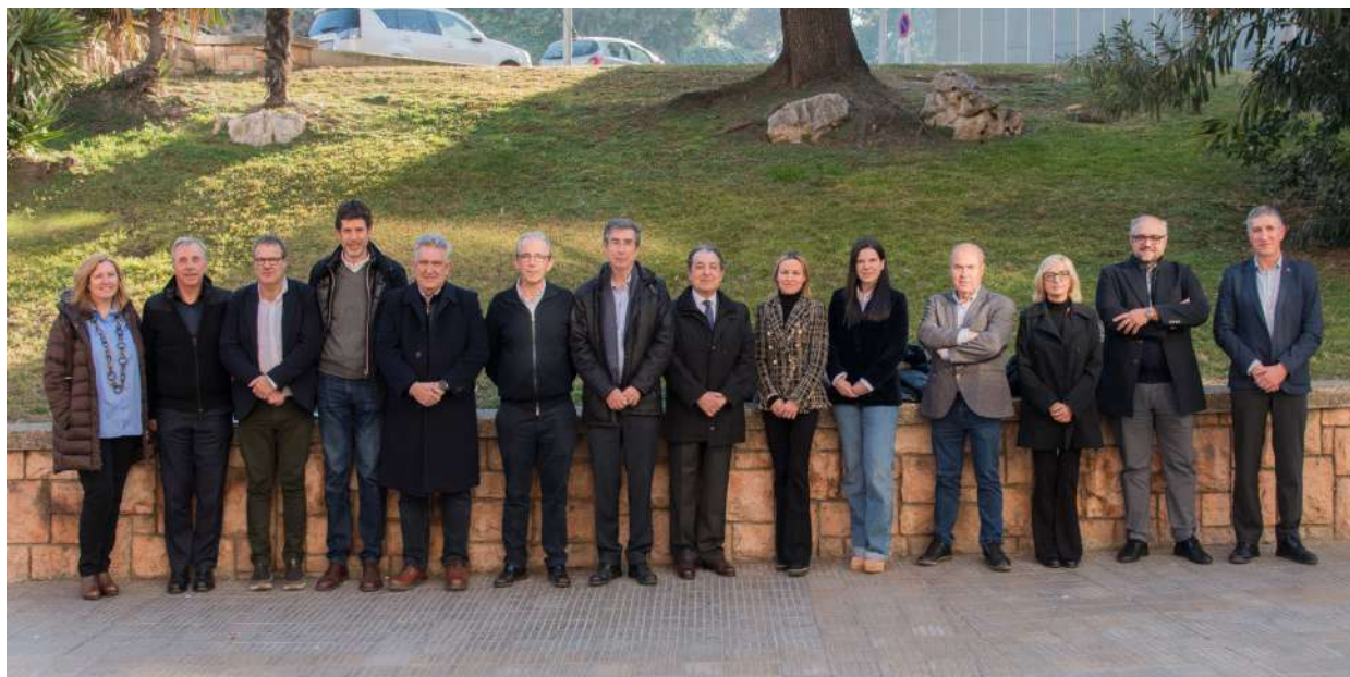
Forum de participació del Consell Social CONNECTAUdL 23. Foto 27