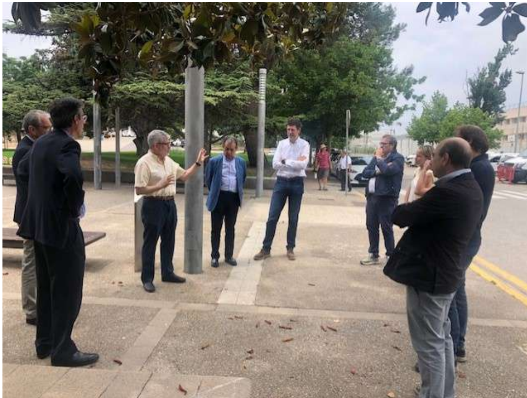
Moment de la rebuda de CONNECTAUdL a ETSEAFIV. Foto 43.