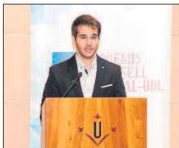
MARC GALOFRÉ CASES

Treball Fi de Grau: d'una indústria elaboradora de manganina amb una producció de 200.000 kg anuals situada a Cervera.