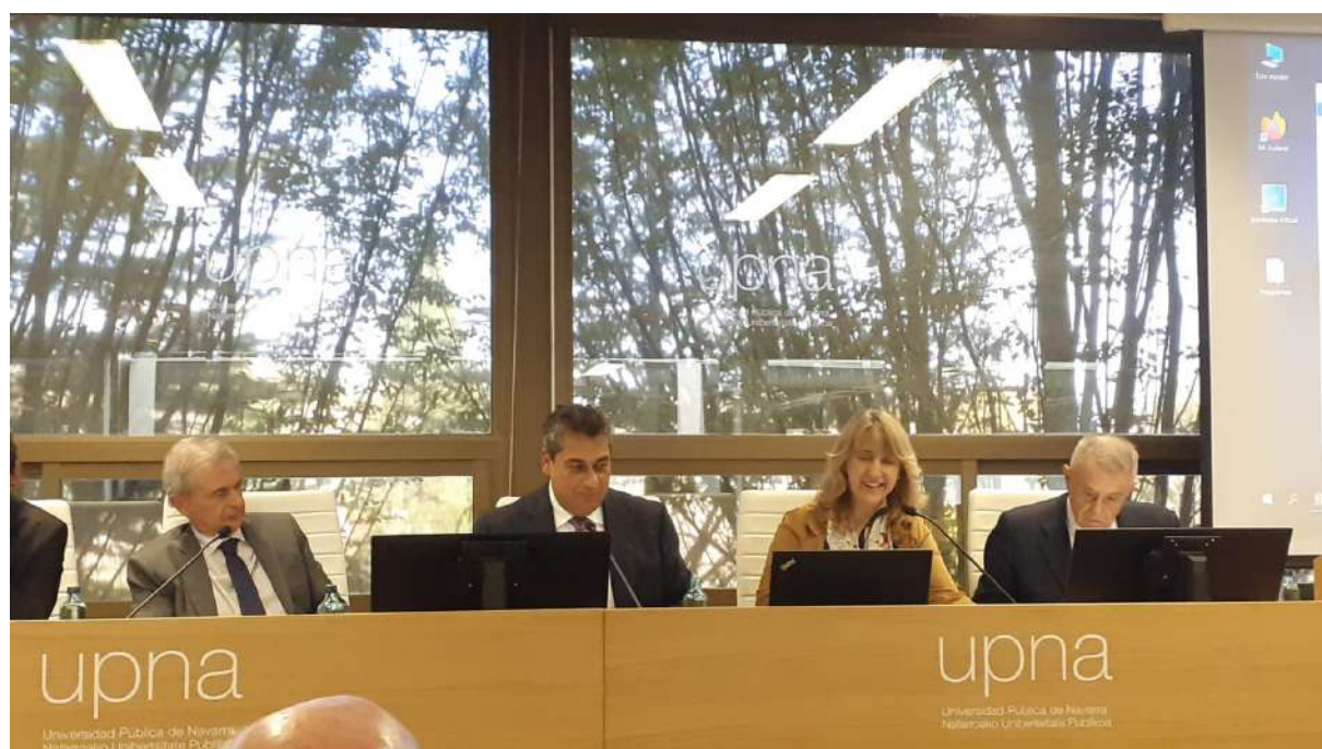
Acte de presentació de les Jornades "Dialogos sobre futuro, talento y desarrollo: el Consejo Social y la apertura de la Universidad al entorno", celebrades a la UPNA. Foto 8