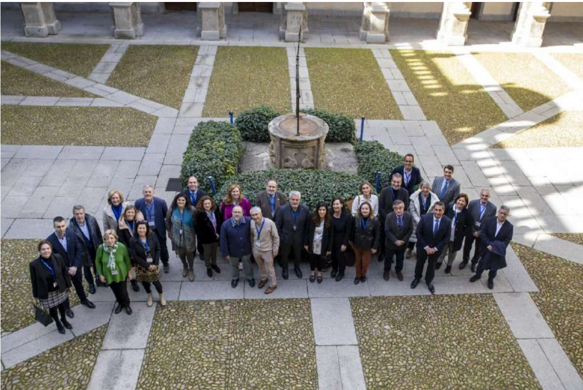
Trobada de secretaris de Consells Socials a Alcalá de Henares. Foto 29