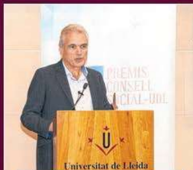
Categoria gran empresa Argal Alimentación, S.A.