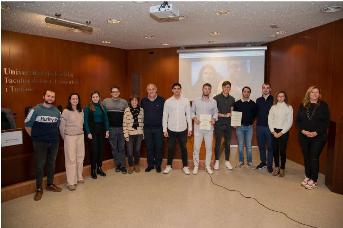
Acte lliurament de Premis Concurs Idea UdL-ODS. Foto 22