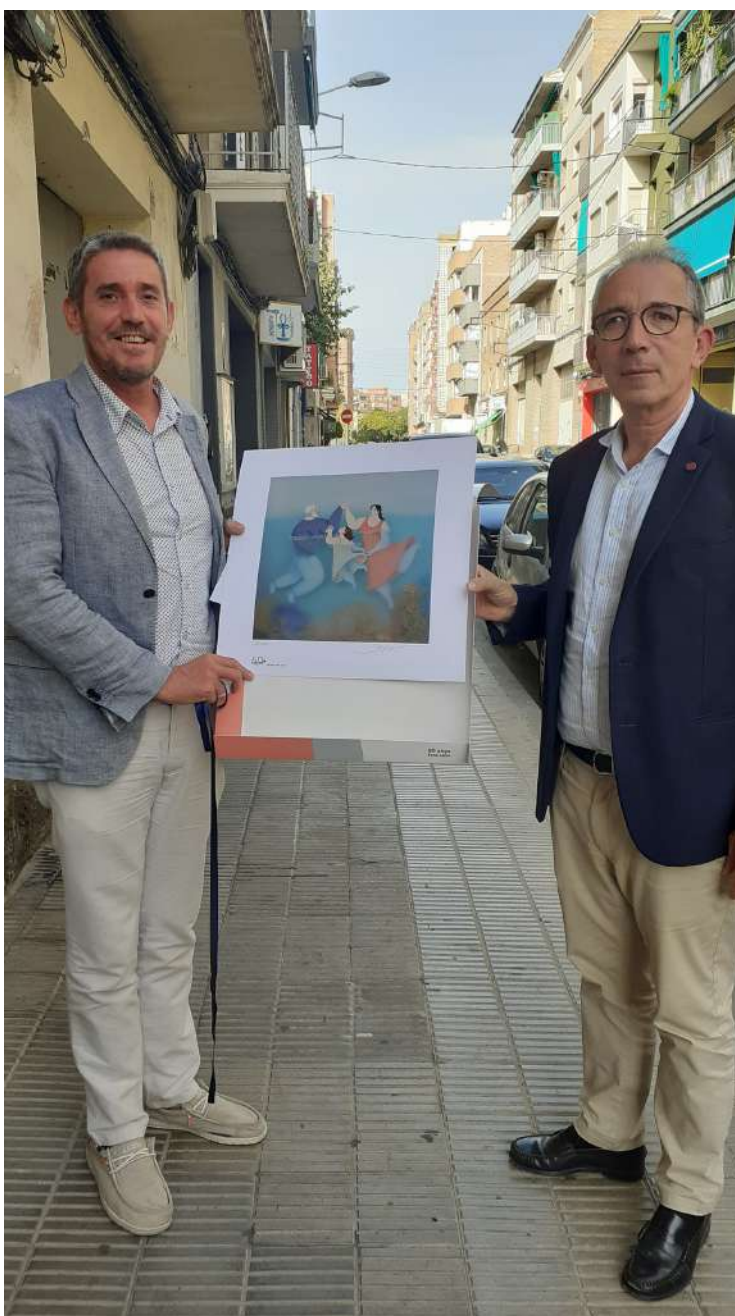
Lliurament litografia commemorativa dels 60 anys de la Fundació Aspros. Foto 11