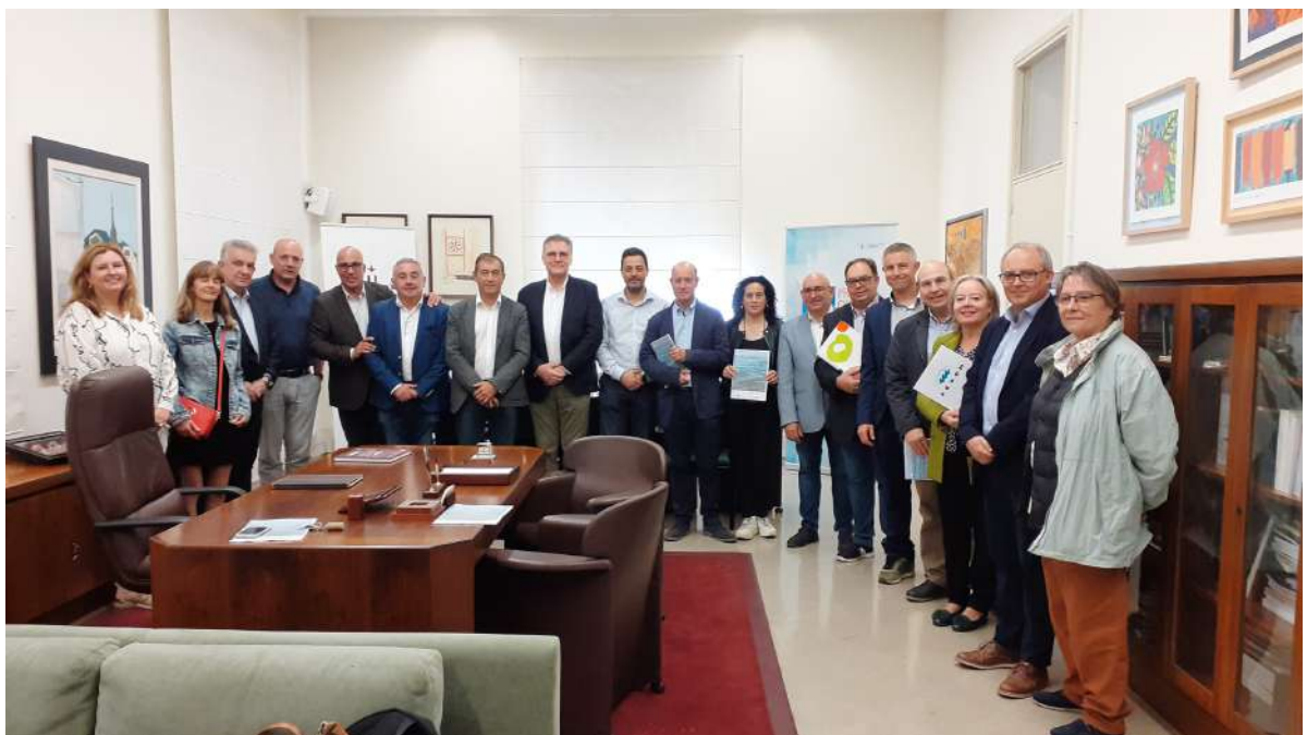
Representants de Forum Secore al Consell Social. Foto 6