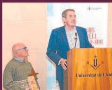
Reconeixement al lideratge social

Federació de Cooperatives Agràries de Catalunya