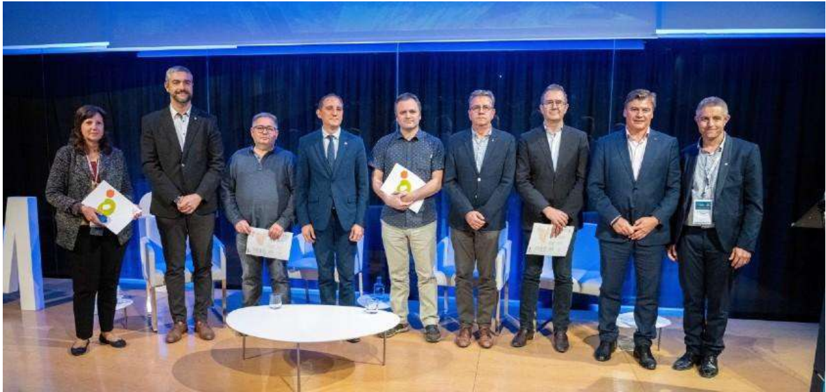
Moment del lliurament de premis Pimec Lleida. Foto 9