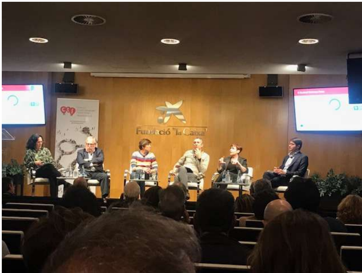
Jornada de l'ACUP "Catalunya Futura". Foto 26