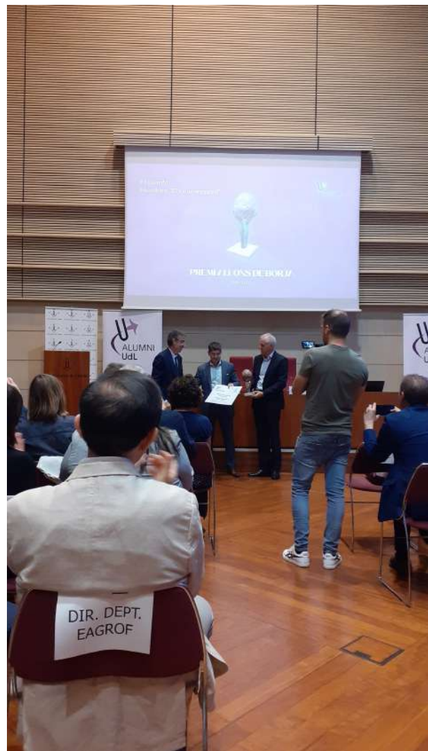
Acte Lliurament Premi Alfons de Borja Alumni UdL Foto 2