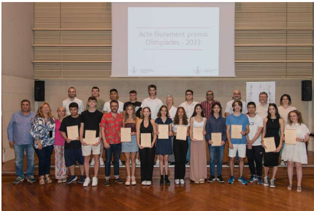
Acte lliurament premis Olimpíades Foto 43.