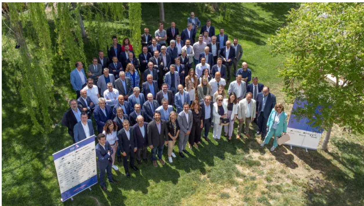
Assistents a la presentació de la Trobada empresarial al Pirineu 2023. Foto 35