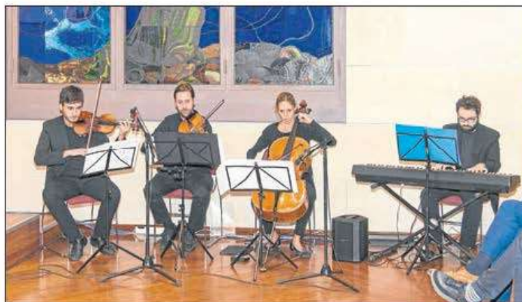
Un detall del concert que va amenitzar l'entrega de premis.

Per finalitzar, el Consell Social reconeix el lideratge social d'alguna institució o entitat vinculada amb el territori. Enguany el guardó s'atorga a la Fundació Aspros, per la seva aportació a la societat lleidatana principalment en la integració de les persones amb capacitats diferents. L'entitat commemora enguany el seu 60è aniversari.