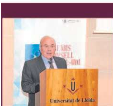
Reconeixement a la institució pel seu compromís amb la UdL

Centre: Facultat d'Infermeria i Fisioteràpia.