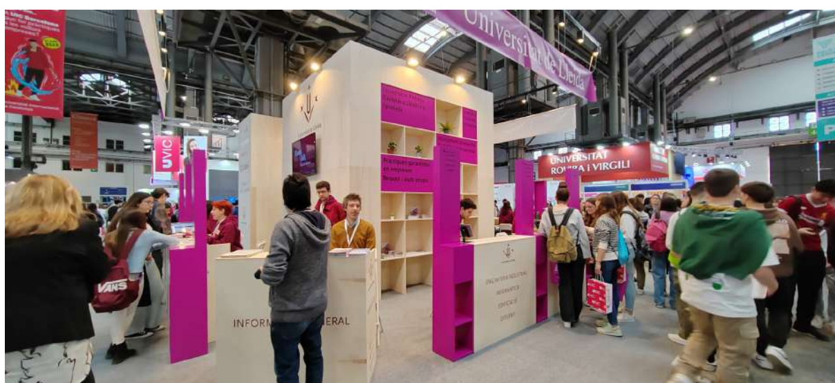
Estand de la UdL al Saló de l'Ensenyament. Foto 31