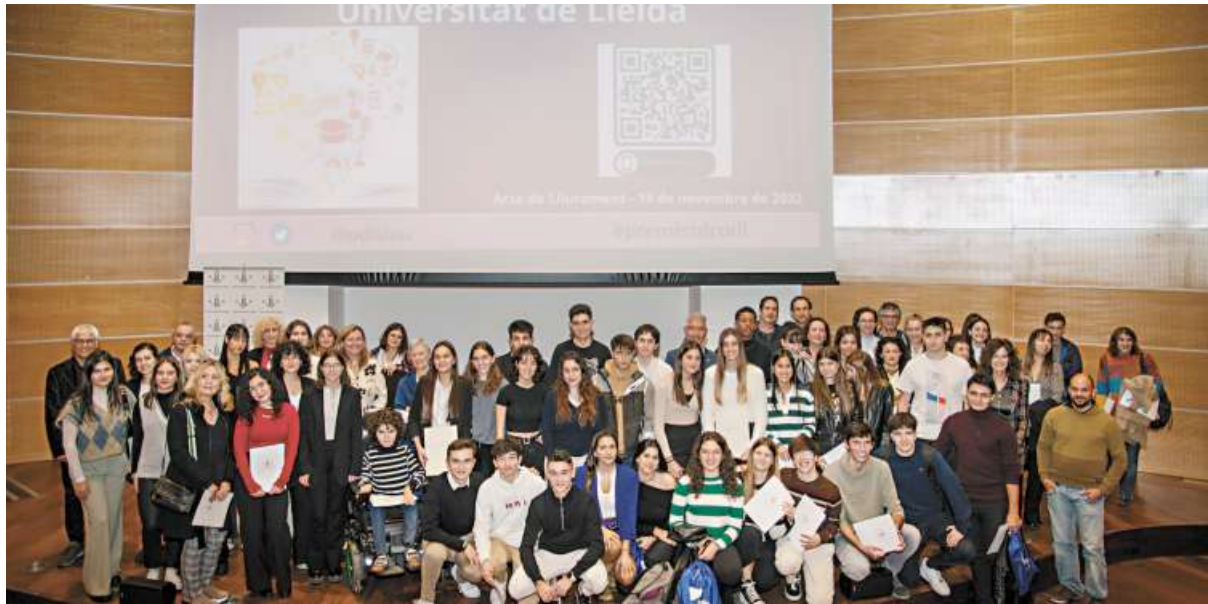
Acte lliurament Premis Treballs de Recerca. Foto 18