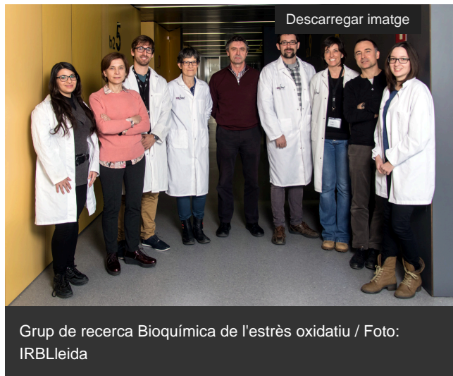
Grup de recerca Bioquímica de l'estrès oxidatiu

Investigadors de la Universitat de Lleida (UdL) i l'Institut de Recerca Biomèdica de Lleida (IRBLleida) intentaran validar el potencial terapèutic del calcitriol [ https://es.wikipedia.org/wiki/Calcitriol ], un metabòlit actiu de la vitamina D3, per tractar l' Atàxia de Friedreich [ https://ca.wikipedia.org/wiki/At%C3%A0xia_de_Friedreich ], una malaltia rara neurodegenerativa que es caracteritza per una destrucció de certes cèl·lules nervioses de la medul·la espinal, el cerebel i els nervis que controlen els moviments musculars en els braços i les cames. L' Associació francesa de l'Atàxia de Friedreich [ https://www.afaf.asso.fr/ ] ha concedit una ajuda de 25.000 euros per aquest estudi.