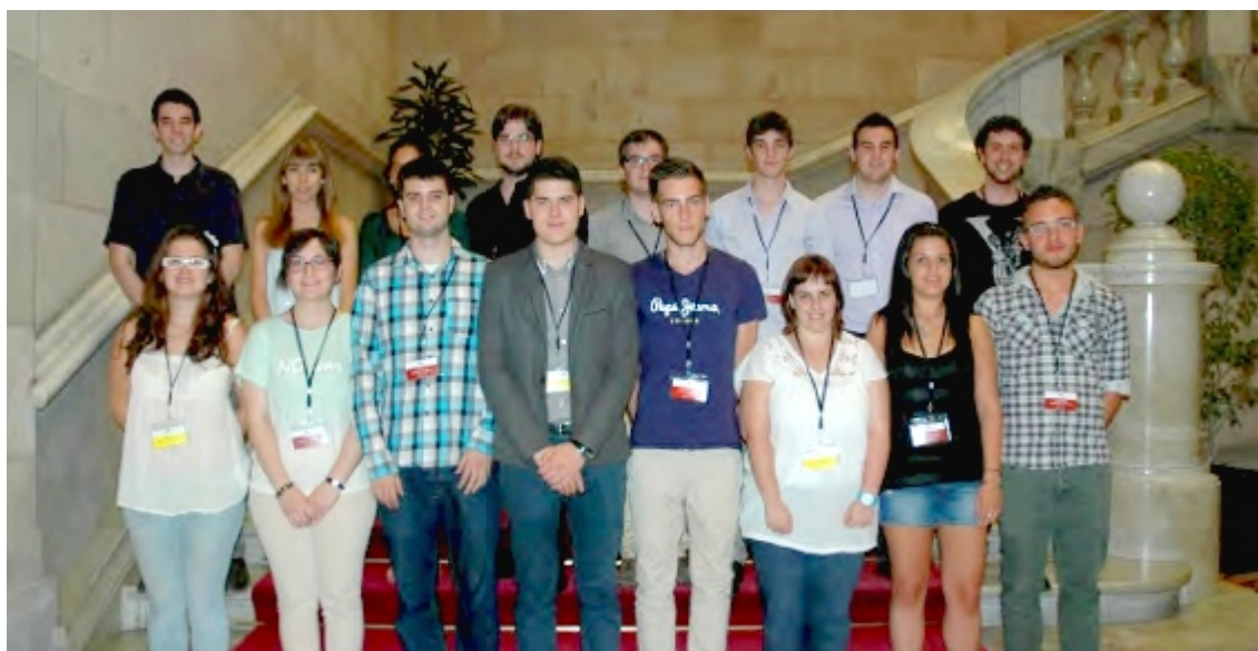
Els membres del 'Govern' universitari, amb 3 estudiants de la UdL

L'experiència consisteix en esdevenir diputats, periodistes, juristes o desenvolupar altres tasques. Una alumna de la UdL ha exercit com a secretària de la Mesa del Parlament, mentre tres companys seus han estat consellers del Govern, a les carteres de Governació, Agricultura i Justícia. Cabasés destaca que l'alumnat agafa experiència en el treball en grup, les competències transversals i l'oratória.