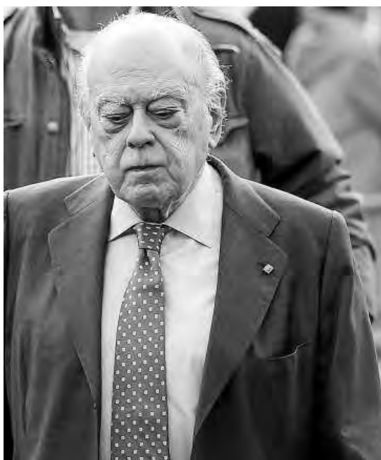
El expresident, en una anterior comparecencia.