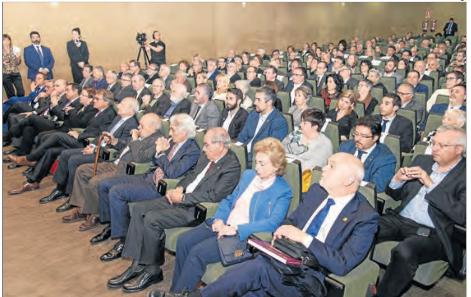
L'acte de commemoració del 25 aniversari del Consell Social de la UdL es va celebrar a la sala d'actes del Rectorat.

Jordi Pujol va dir que “la transformació del país ha estat fonamental i la UdL n'és un exemple”. “El país el tirem endavant entre tots”, va apuntar, i, malgrat que va assegurar que no parlaria de política va fer una crida al diàleg per desencallar el conflicte entre Catalunya i Espanya. “Esperem que la política s'orienti bé i hi hagi capacitat de