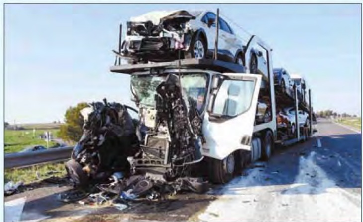
Estado en que quedó el vehículo que conducía la mujer, de 46 años, tras el impacto

► Otros dos accidentes sin víctimas en Alcoletge provocan cortes de tráfico y colas kilométricas en la A-2