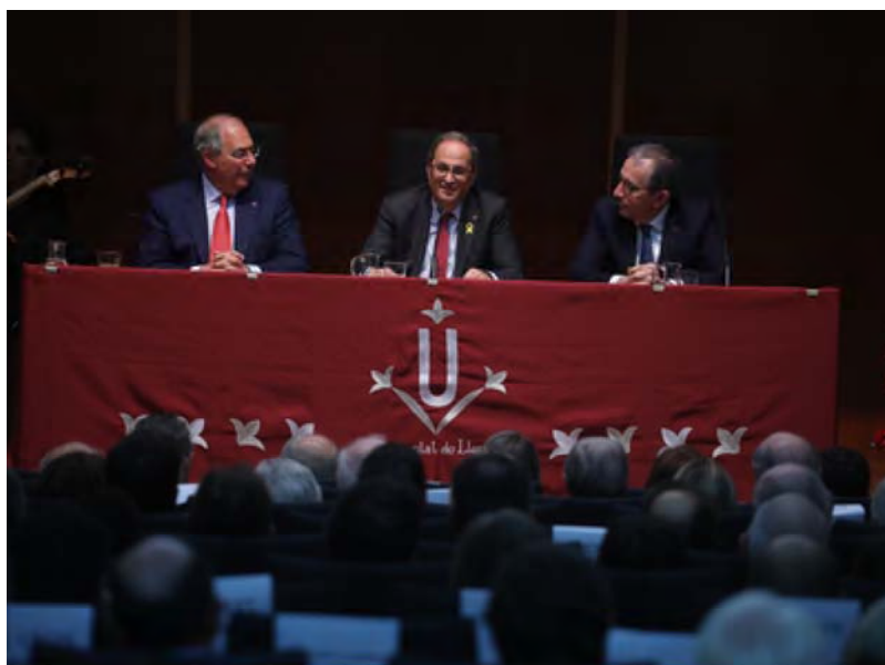
El president Torra amb el rector de la UdL i el president del Consell Social de la universitat.

El president de la Generalitat, Quim Torra, ha assegurat aquesta tarda que "és un objectiu compartit per tots" que "la Universitat compleixi la seva funció social, acadèmica, de formació i de transformació" .