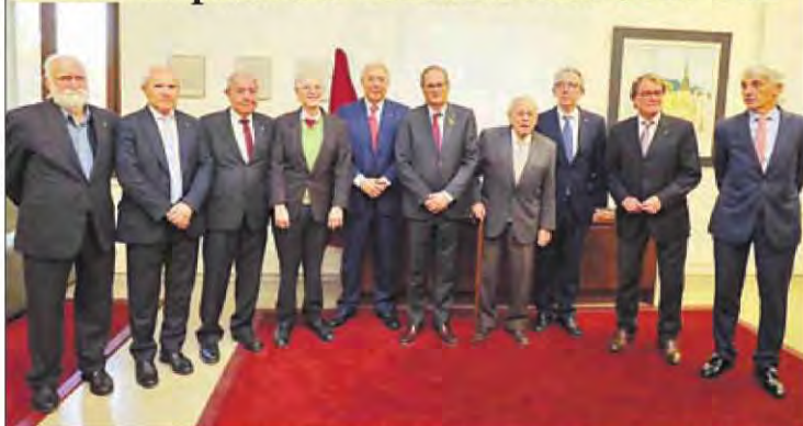
Quim Torra y los Presidents Pujol, Montilla y Mas asistieron al acto