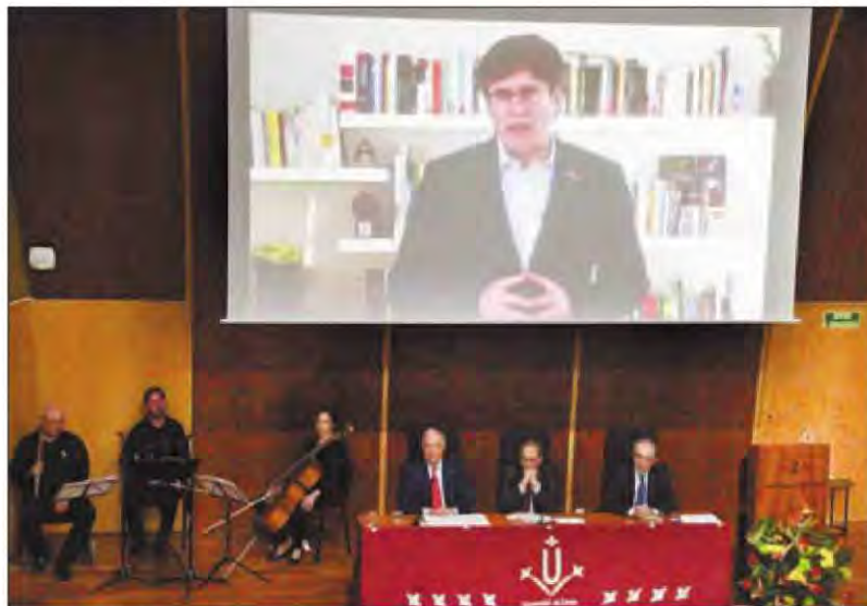
L'expresident Puigdemont també va estar present a la UdL, encara que de manera virtual

Així ho va dir en l'acte de commemoració del 25è aniversari del Consell Social de la Universitat de Lleida (UdL), on va posar en valor la “funció transcendent” que tenen aquests òrgans i va defensar que aquesta “hauria d'anar a més amb un sistema de governança més flexible i una plena autonomia, tal i com desitgem”. Torra va apuntar al “compromís social, millora de la vida universitària, pont on es construeix el diàleg entre universitat, societat i empresa, i reforç dels vincles entre sector públic, universitat, societat civil i sector productiu, han estat el pal de paller d'aquest quart de segle de vida d'aquesta institució”. El president va destacar especialment “la funció de transparència i supervisió molt