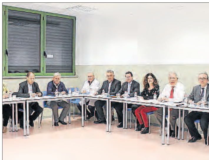
Imatge d'arxiu d'una reunió del consell social.

Està compost per representants del Parlament, organitzacions sindicals i empresarials, ens locals i antics alumnes, a banda d'integrants del personal d'administració i serveis, docents i estudiants. En total,