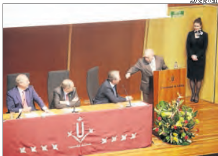
Jordi Pujol, durant la seua intervenció.

diàleg per tots costats. Perquè molta gent diu que hem de parlar, però encara no n'he sentit gaires que facin propostes que permetin que la gent s'assegui (a parlar) ni d'una banda ni de l'altra”.