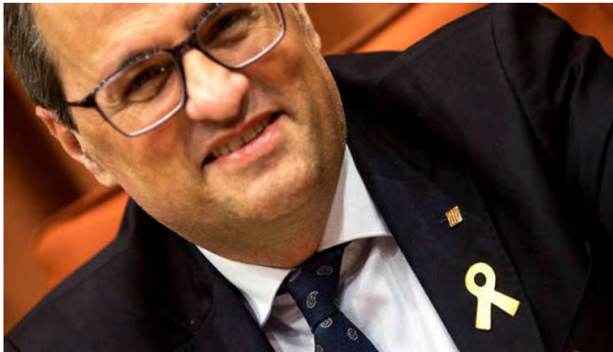
Quim Torra