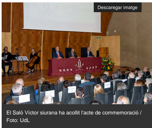
El Saló Víctor Siurana ha acollit l'acte de commemoració

Altrament, el president de la Generalitat, Quim Torra, s'ha adreçat als presidents del Consell Social presents per expressar-los que "sense el vostre tarannà i la vostra dedicació no hauríem arribat on som", i ha assenyalat que avui la universitat catalana suposa equilibri territorial i transformació, però que encara hi ha molt per fer en aquest sentit.