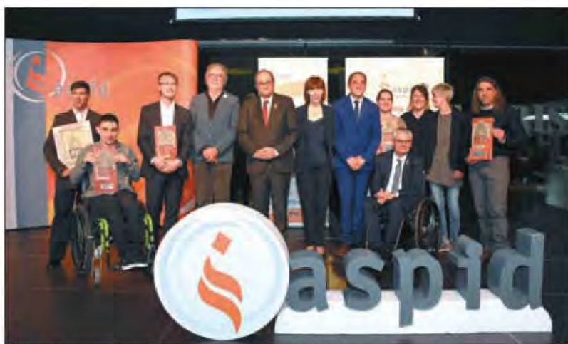
El president Torra amb autoritats de Lleida i amb els premiats per Aspid

pròxims 25 anys seguiu ajudant a transformar Lleida i Catalunya”, va concloure. Torra va presidir el lliurament dels XXI Premis Aspid i l'acte va comptar amb l'assistència de 270 persones. El treball i l'esforç per la inclusió social a través de la música, l'esport, l'humor i la ocupació laboral van ser els guanyadors. El grup Roba Estesa,