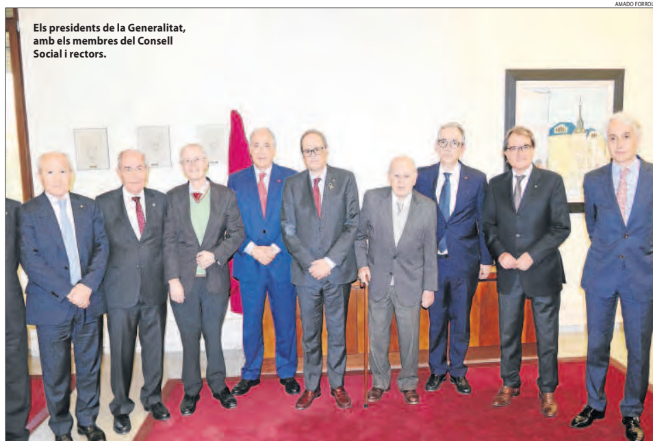
Els presidents de la Generalitat, amb els membres del Consell Social i rectors.