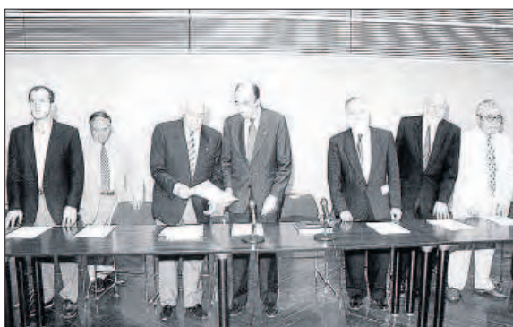
La constitució del Consell Social, amb el seu primer president.

Precisament, cita aquest últim aspecte com a repte a po-