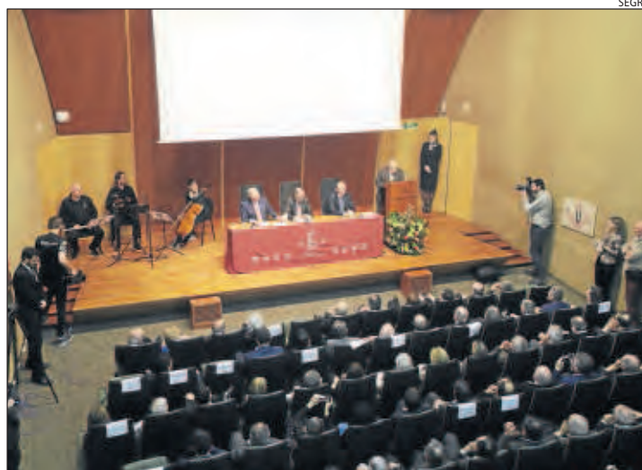
Un moment de l'acte, celebrat ahir al Rectorat de la UdL.