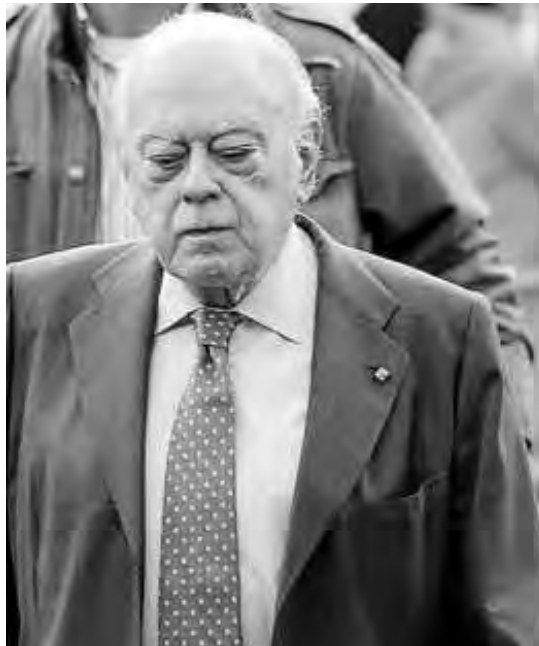
El expresident, en una anterior comparecencia.